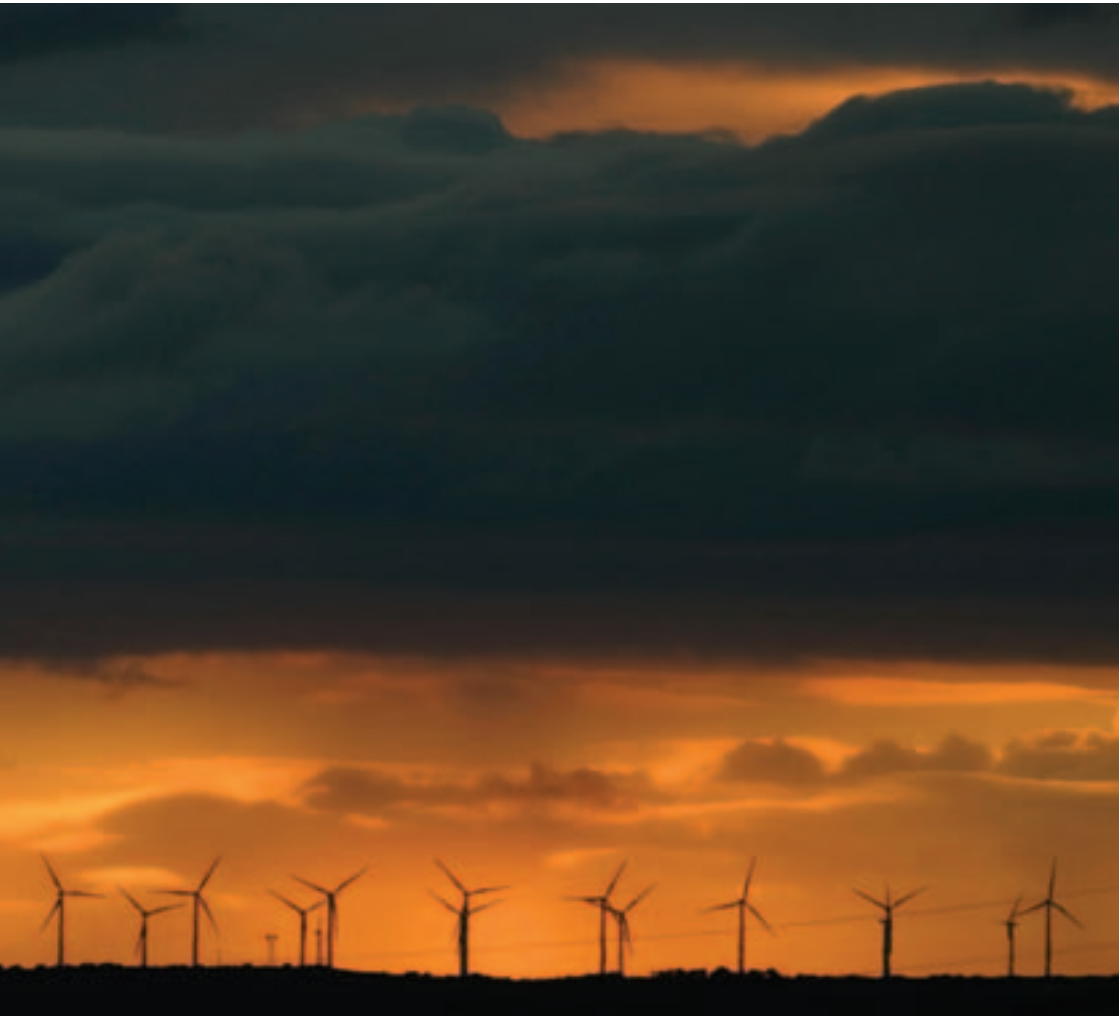
Alternative Energien: Windturbinen in Zentralspanien