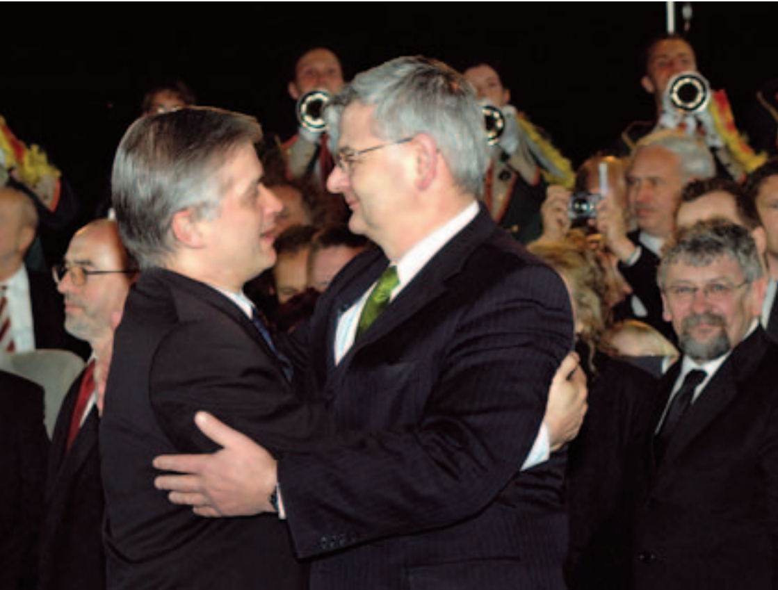
Bundesaußenminister Fischer und sein polnischer Amtskollege Cimoszewicz bei der Beitrittsfeier am 1. Mai 2004

Diese Zusammenarbeit auf allen Ebenen hat besondere Bedeutung, denn Deutschland und Polen sind wirtschaftlich eng miteinander verflochten. Deutschland ist größter Handelspartner Polens, Polen Deutschlands zweitgrößter Handelspartner im Osten (seit 2001 überholt von Tschechien). Die deutschen Investitionen in Polen – schwerpunktmäßig solche kleiner und mittlerer Unternehmen – steigen kontinuierlich. Eine Reihe typisch »deutscher« Produkte wird bereits