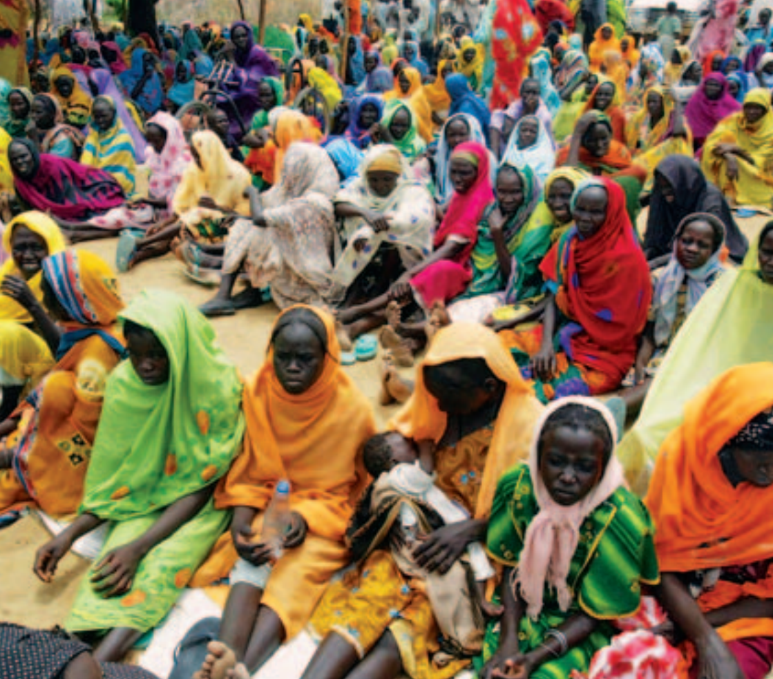
Flüchtlinge aus Darfur, August 2004

die Regierung Öl ins Feuer, denn bereits in den achtziger Jahren waren Arabisierungsbestrebungen in Darfur erkennbar. Die sudanesishe Regierung instrumentalisierte das bereits bestehende Konfliktpotential nun, um ihre eigenen Interessen zu verfolgen.