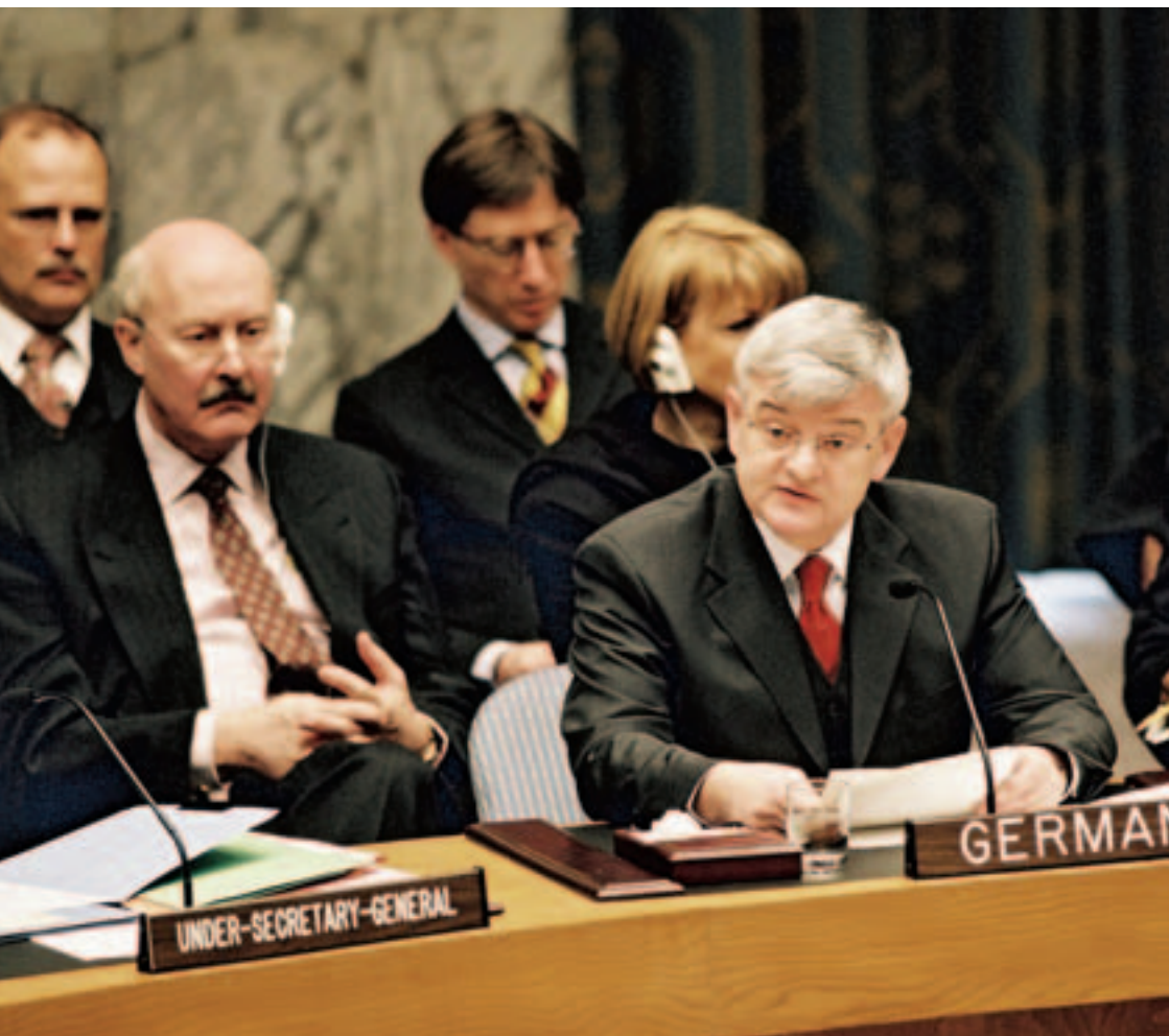
Bundesaußenminister Joschka Fischer und UN-Botschafter Gunter Pleuger im Sicherheitsrat der Vereinten Nationen in New York