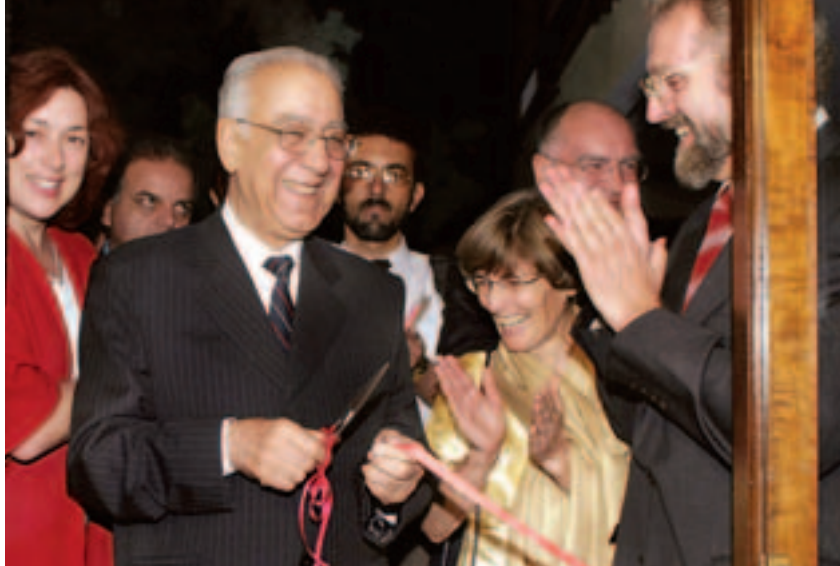
Eröffnung des Goethe-Instituts in der afghanischen Hauptstadt Kabul, September 2003

Nachfrageorientierung. Dies bedeutet eine an den Interessen unserer Kunden orientierte Gestaltung der Kulturarbeit im Ausland und eine Beteiligung dieser Kunden an der Finanzierung dort, wo dies wirtschaftlich machbar ist. Deutschland hat im Ausland ein attraktives Kultur- und Bildungsangebot. Deshalb gilt es, die Attraktivität zu nutzen und die Programme so zu gestalten, dass unsere ausländischen Kunden bereit sind, für das Angebot auch zu zahlen.