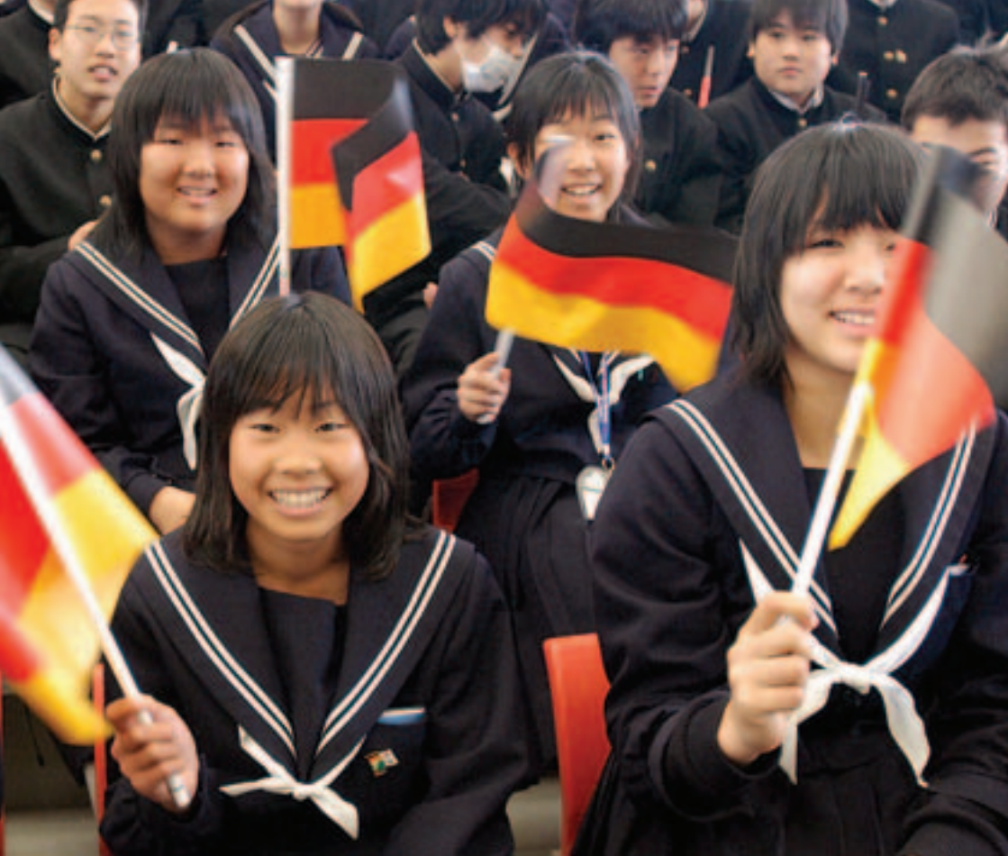
Deutscher Nationentag auf der Expo 2005 in Japan

wurde das Deutschlandjahr am 4. April 2005 in Tokio im Rahmen einer Ausstellung von Meisterwerken der Berliner Museumsinsel.