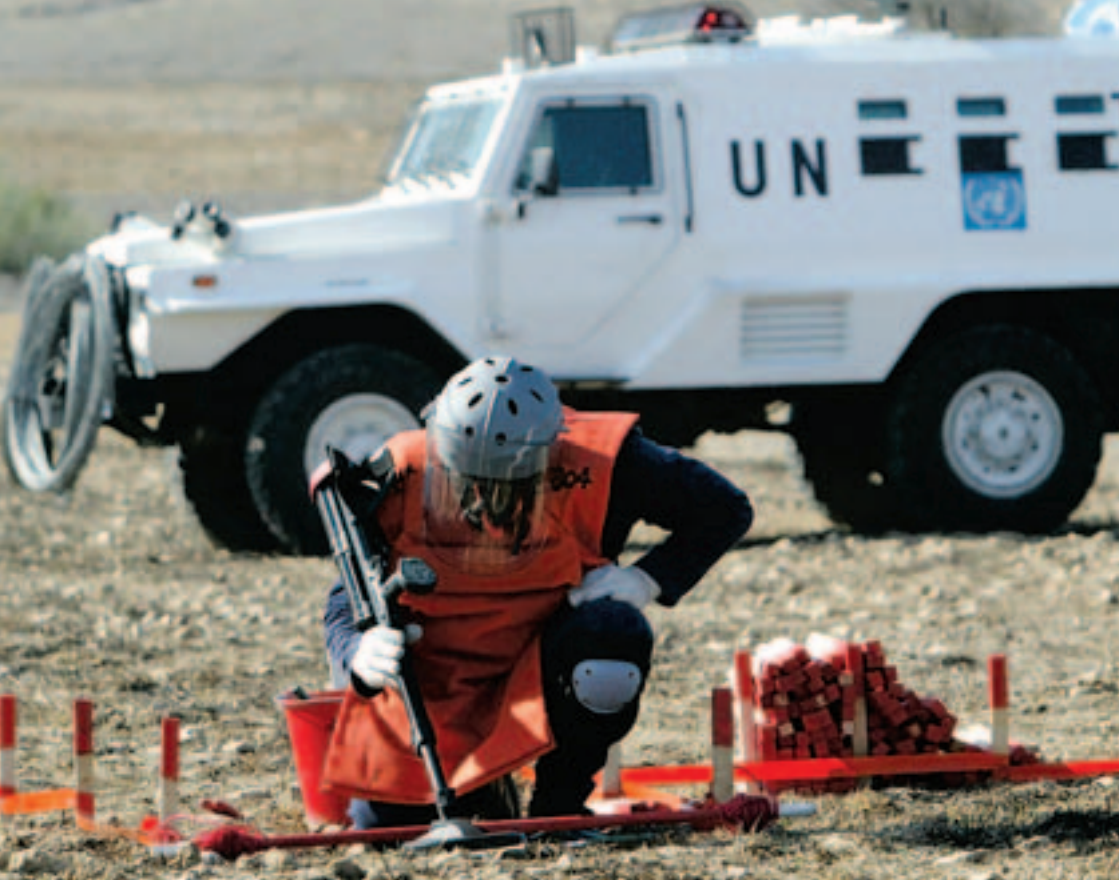
Minenräumung auf Zypern, November 2004