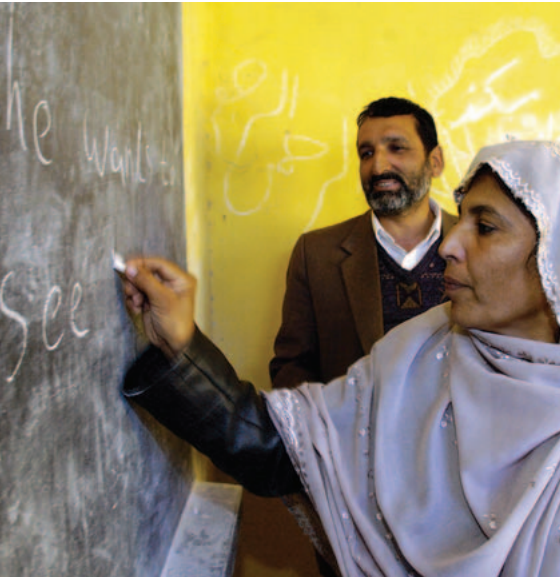
Lehrerausbildung in einer neu errichteten Schule in Kundus, November 2004