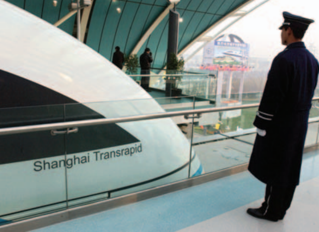
Deutsche Technik in China: Magnetbahn Transrapid in Shanghai

Die Auslandsvertretungen (Botschaften und Generalkonsulate) unterstützen deutsche Firmen auf vielfältige Weise. Hierzu einige Beispiele :