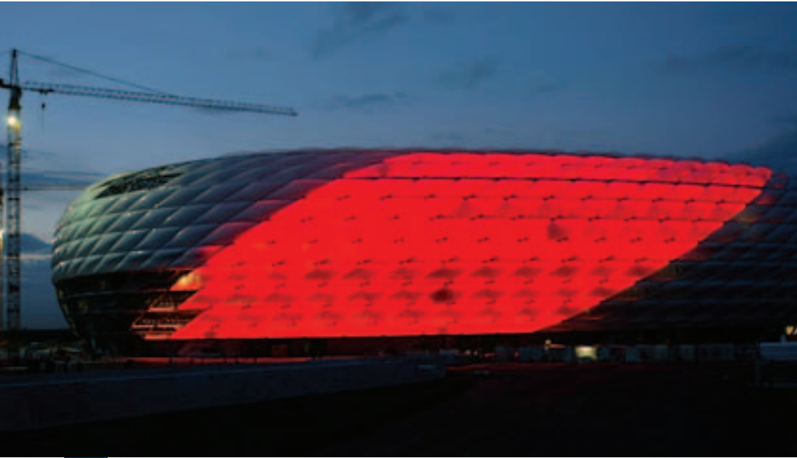
WM-Stadion mit 66000 Plätzen: Allianz-Arena in München

schrift »Deutschland« oder das Nachschlagewerk »Tatsachen über Deutschland« in den Dienst der WM. In enger Zusammenarbeit mit dem WM-Stab 2006 im Bundesinnenministerium (BMI) und der zentralen Koordinierungsstelle für alle Vorbereitungsarbeiten der Bundesregierung im Rahmen der WM 2006 wurde ein zehnminütiger Videoclip produziert. Ebenfalls zusammen mit dem WM-Stab wurde eine Informationsbroschüre zur Verteilung durch die Auslandsvertretungen herausgegeben. Sogar eine eigene Website zur FIFA Fußball-Weltmeisterschaft 2006 wurde im Auswärtigen Amt entwickelt: Unter der Adresse www.socceringermany.info können sich Interessierte umfassend über die WM 2006 in Deutschland informieren. Darüber hinaus wurde die offizielle Website der Bundesregierung auf der Cebit 2005 freigeschaltet. Auf eines wird man jedoch im In- und Ausland verzichten müssen: Ein offizieller Song der deutschen Nationalmannschaft zur WM 2006 ist bislang nicht geplant.