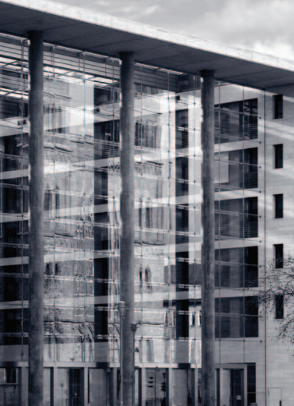
Auswärtiges Amt, Eingang zum Neubau am Werderschen Markt