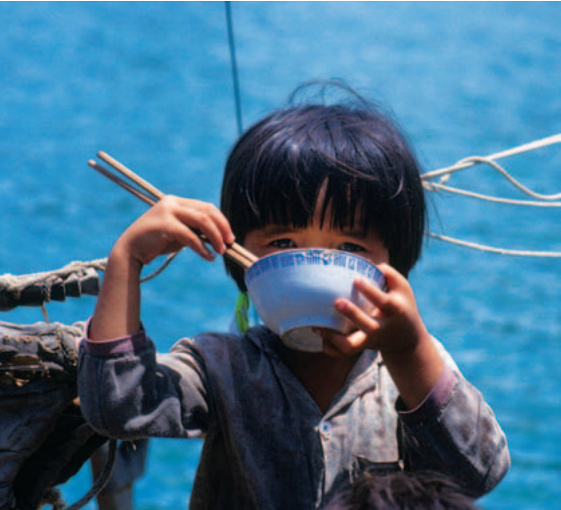
Menschenrecht auf Ernährung: Vietnamesisches Kind