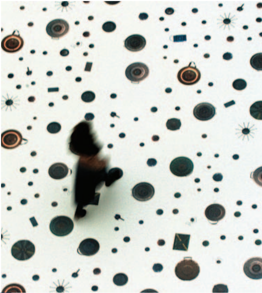
Ausstellung »Das virtuelle Minenfeld« im Lichthof des Auswärtigen Amtes in Berlin, November 2004