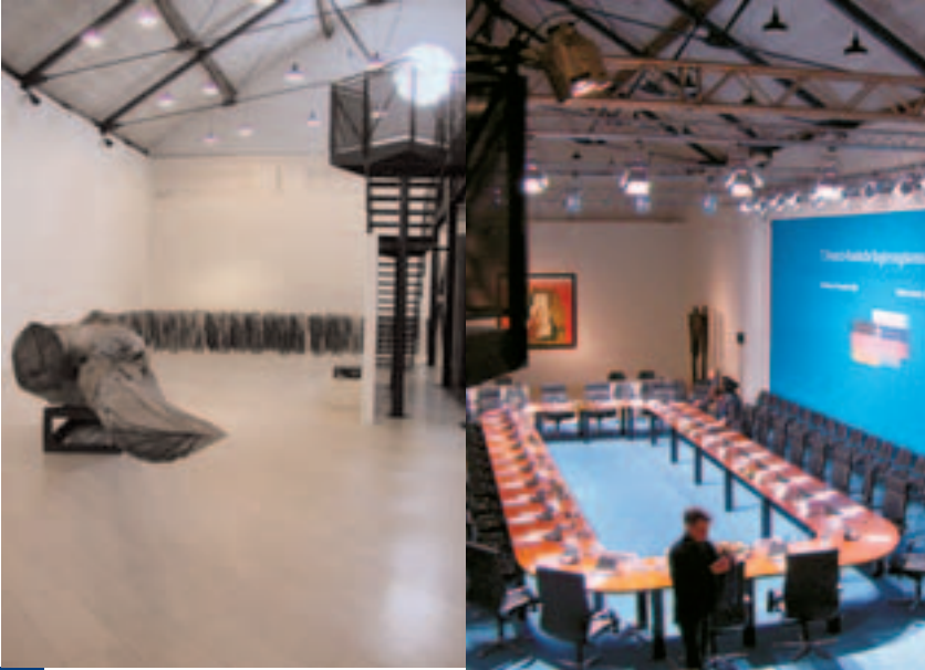
Die »Reithalle« im Schloss Gottorf vor und nach dem Umbau in einen Konferenzsaal.

möbel. Eine auf verschiedene Stimmungen programmierbare Illumination ließ den Raum und seine temporären Einbauten, wie z. B. Dolmetscherkabinen und einen großen Rückhorizont, im richtigen Licht erscheinen. Die Farben der extra eingebrachten Teppichböden wurden mit den Mietmöbeln und dem anzufer-tigenden Rückhorizont abgestimmt. Unsere Mühe wurde belohnt: Das »fertige Produkt« erweckte den Eindruck, dass dieser Konferenzraum immer schon so ausgesehen habe.