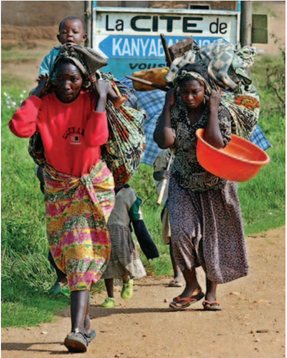
Flüchtlinge im eigenen Land, Kongo, Dezember 2004