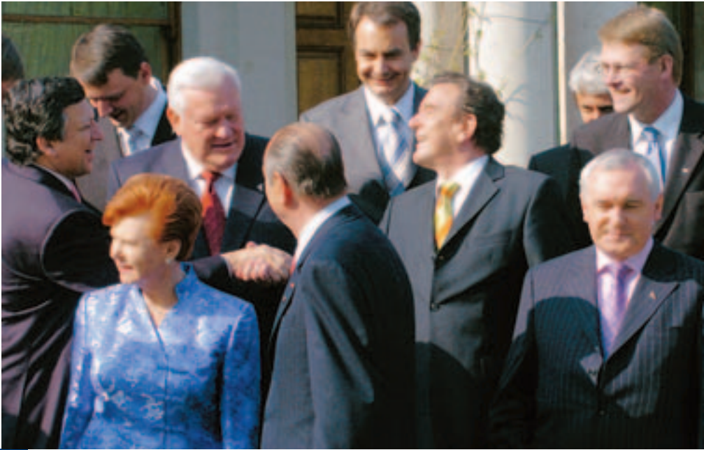
EU-Erweiterung: Die Staats- und Regierungschefs der Europäischen Union feiern die Aufnahme der zehn neuen Mitgliedsstaaten, Dublin, Mai 2004

Von großer Bedeutung für die weitere Integration der Union ist die Möglichkeit, durch einstimmigen Beschluss des Europäischen Rats den Übergang von der Einstimmigkeit in die qualifizierte Mehrheit zu beschließen. Dies eröffnet die Möglichkeit, längerfristig auch diejenigen Bereiche in die qualifizierte Mehrheit zu überführen, bei denen dies in der Regierungskonferenz noch nicht gelungen ist.