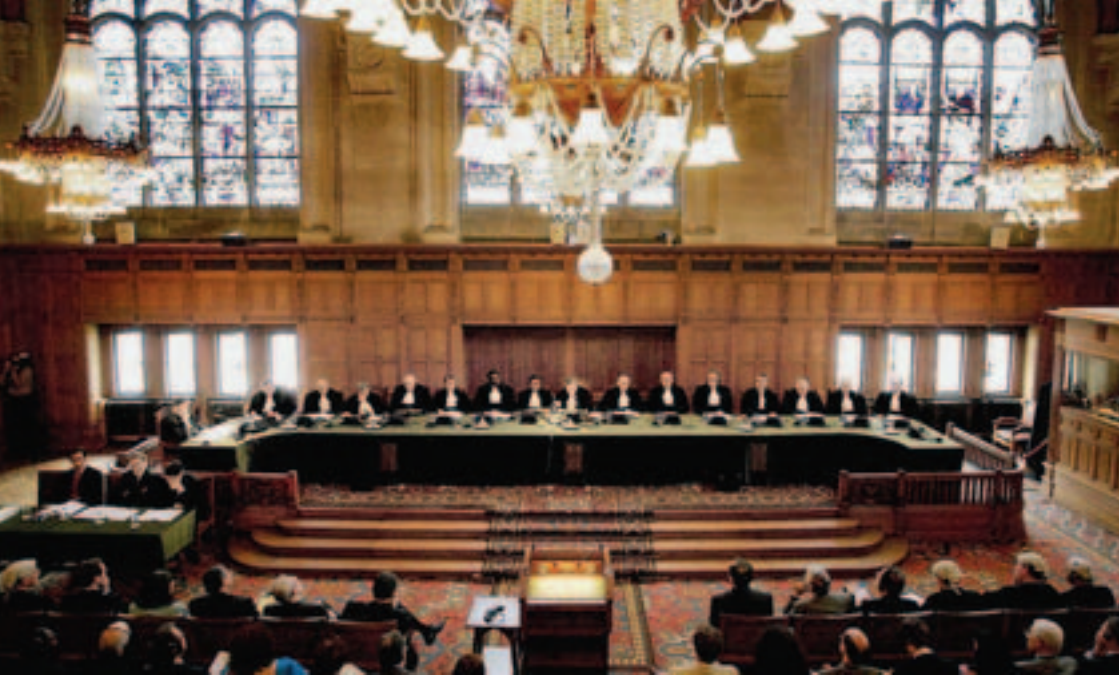
Der Internationale Gerichtshof in Den Haag

Die Einhaltung der Regeln des Völkerrechts ist Voraussetzung für Frieden, Sicherheit und wirtschaftliche Entwicklung. Auch im Rahmen von Krisenprävention und -nachsorge spielen Recht und Rechtsstaatlichkeit eine immer größere Rolle. So wurden – und werden – auch auf regionaler und internationaler Ebene Institutionen zur friedlichen Beilegung von Streitigkeiten und zur Verfolgung schwerer Menschenrechtsverletzungen eingerichtet. Auf europäischer Ebene sind hier vornehmlich der Europäische Gerichtshof in Luxemburg, Rechtsprechungsorgan der EU und der vom Europarat eingerichtete Europäische Gerichtshof für