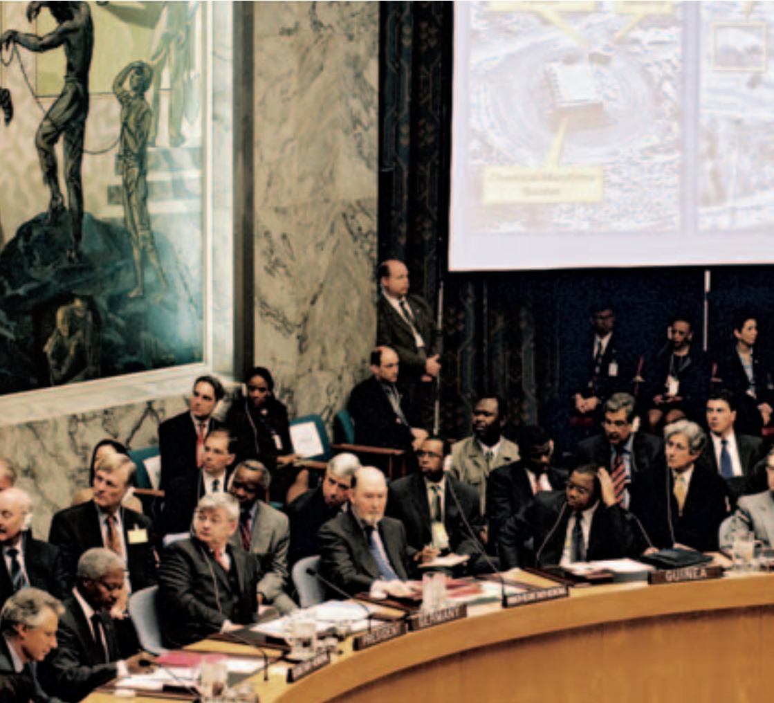
Sitzung des Sicherheitsrats der Vereinten Nationen in New York