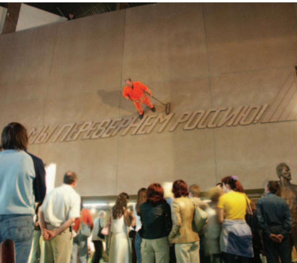
Deutsche Tage in Krasnojarsk, Performance des Künstlers Johann Lorbeer.

und die gesellschaftlichen Beziehungen zwischen beiden Ländern mit Blick auf die Zukunft zu entwickeln.