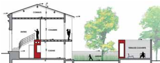
Exemple de plan de coupe (état projeté)

4 Un plan de coupe précisant l'implantation de la construction par rapport au profil du terrain.