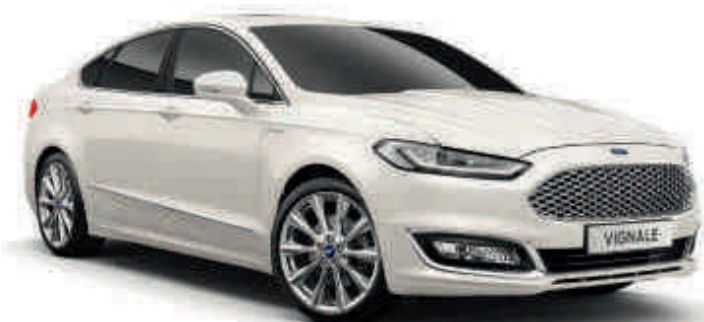
Blanc Platinum Peinture métallisée spéciale