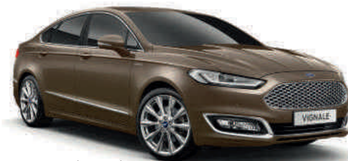
Vignale Nocciola Peinture métallisée spéciale