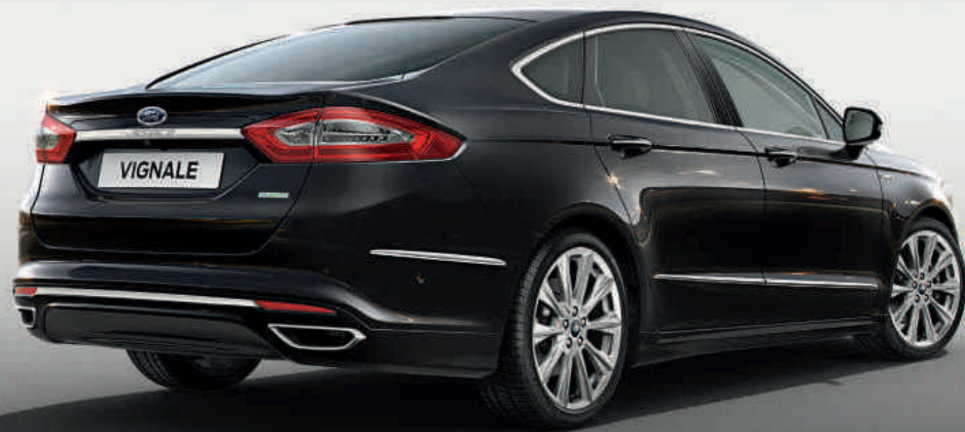
Ford Mondeo Vignale 4 portes.