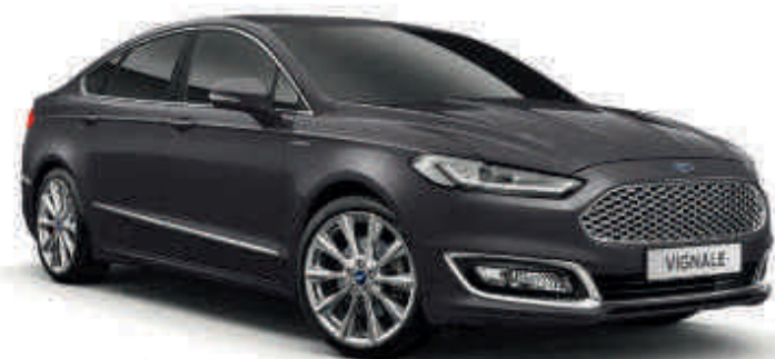
Gris Magnetic Peinture métallisée