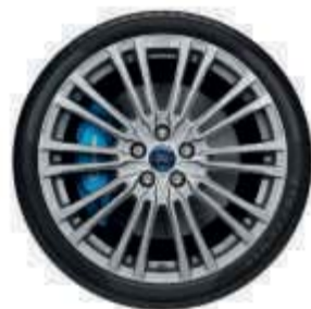
Jantes alliage de série