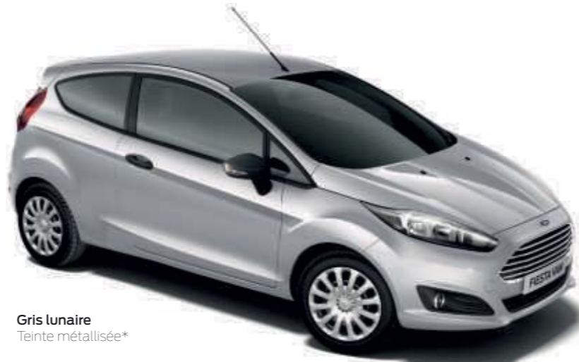
Gris lunaire Teinte métallisée*