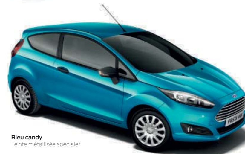
Bleu candy Teinte métallisée spéciale*

Max avec face de siège en Charcoal Black/Soft Charcoal Max avec coussin de siège en Charcoal Black