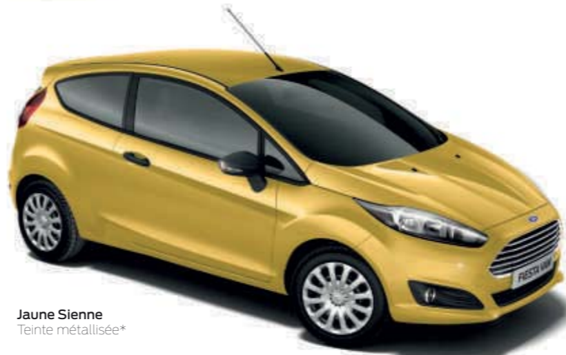
Jaune Sienne Teinte métallisée*