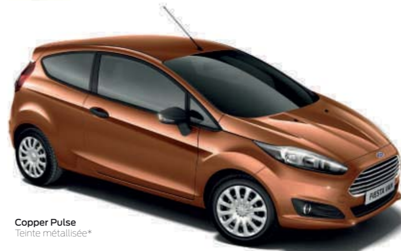
Copper Pulse Teinte métallisée*