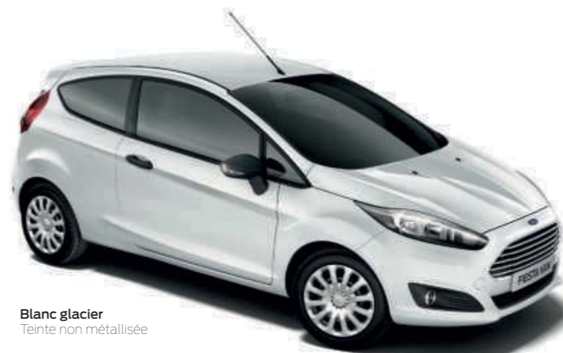
Blanc glacier Teinte non métallisée