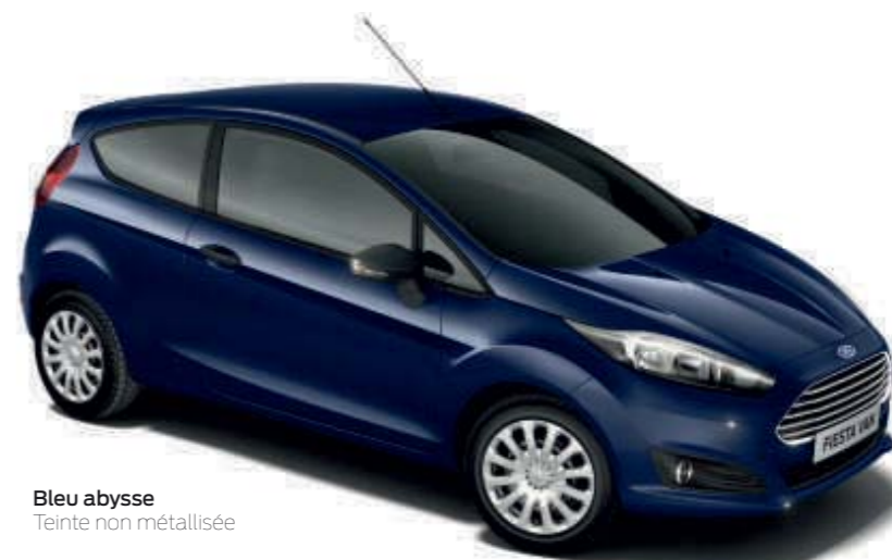
Bleu abyesse Teinte non métallisée