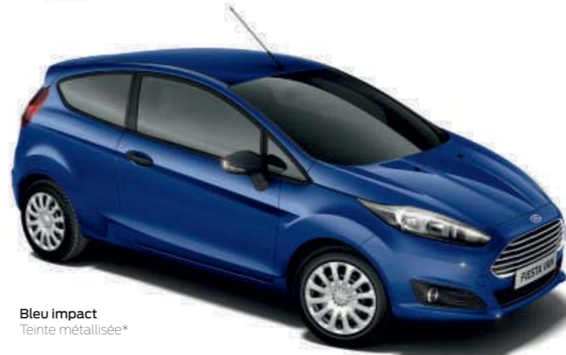
Bleu impact Teinte métallisée*