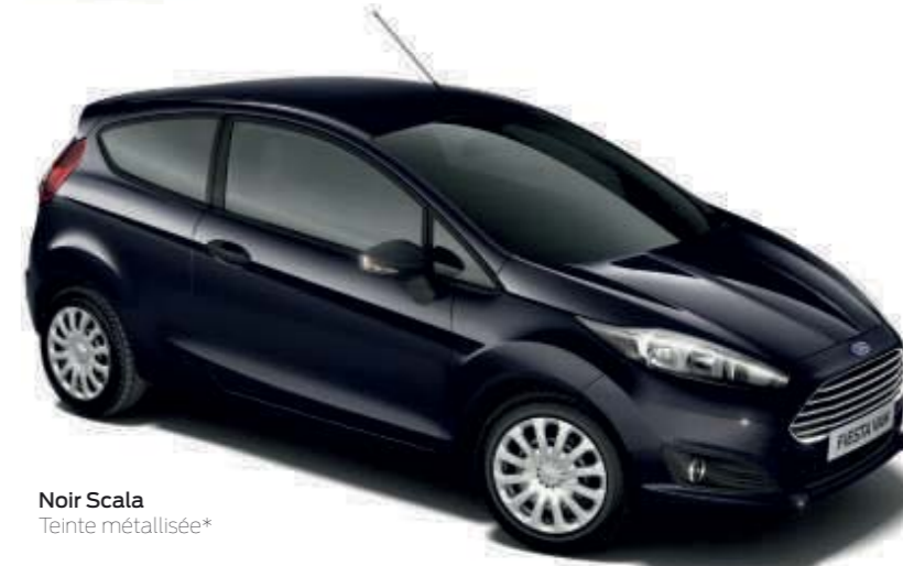
Noir Scala Teinte métallisée*