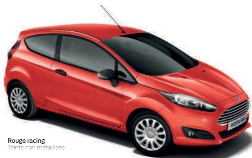
Rouge racing Teinte non métallisée